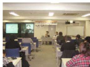
2007年度 国際セミナーの様子